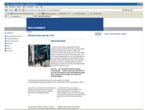
Internet-Präsenz der VOV GmbH

Unter www.vovgmbh.de finden Sie ja schon länger alles über die VOV GmbH, was für potentielle Kunden wichtig ist.